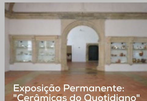
Exposição Permanente: "Cerâmicas do Quotidiano"

Para além da linha Convento de Cristo, com reproduções de peças de loiça conventual, a nossa loja dispõe ainda de uma oferta de artigos exclusivos das lojas DGPC que inclui peças de joalheria, linha infantil, artigos de papelaria e livros de temáticas diversas, tais como a arte, a arquitetura, a história medieval, entre outras.